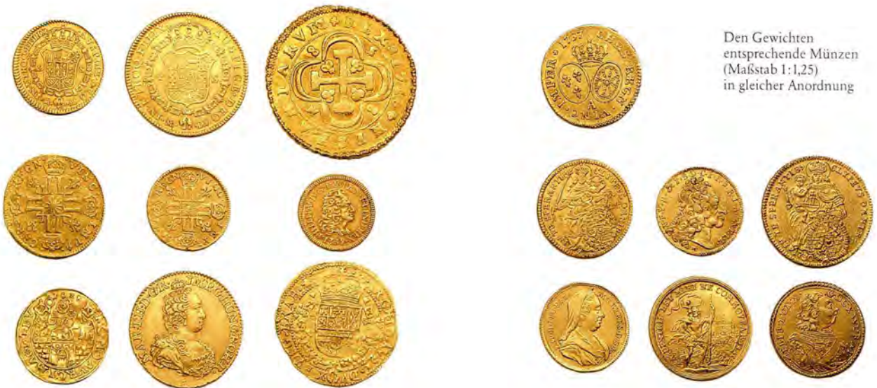
Den Gewichten entsprechende Münzen (Maßstab 1:1,25) in gleicher Anordnung