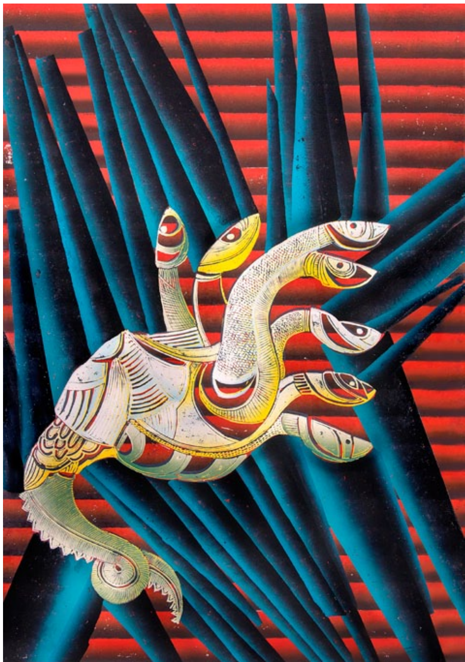
3 Lichtbringer, 2014 Linoldruck auf Papier, Unikat 100 x 70 cm